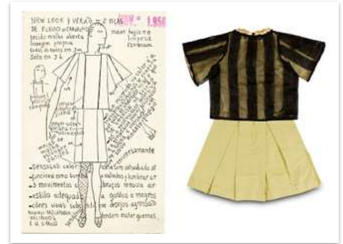
Croqui do traje criado por Carvalho.

A roupa diferenciada, com uma saia e meias arrastão, rompia com os padrões de vestimentas masculinas da época. O traje causou muito alvoroço entre as pessoas, umas refletiam sobre a função da roupa e outras estavam chocadas.