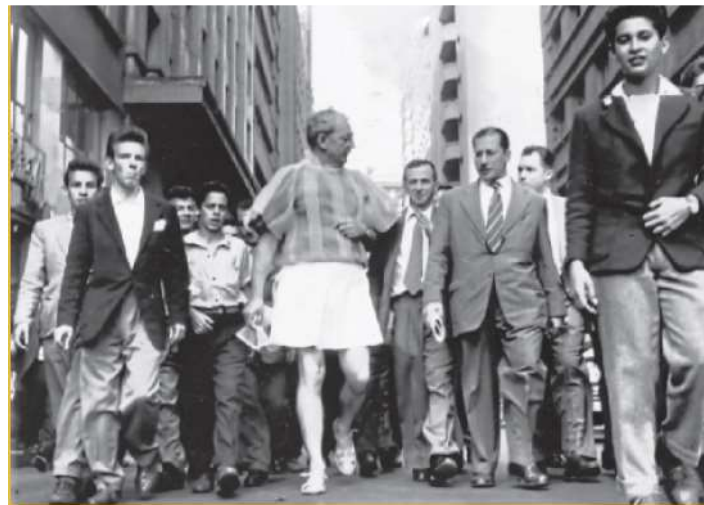
Flávio de Carvalho veste o New Look em sua performance pelas ruas do centro de São Paulo (SP), em 1956.

Criou em 1956 um traje chamado de Experiência nº3 e também de New Look , nome que se firmou. As roupas e a performance provocaram uma reflexão sobre as convenções sociais vigentes na época.