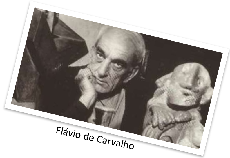
Flávio de Carvalho

O artista Flávio de Carvalho foi um dos pioneiros das performances no Brasil, a partir dos anos 1950. Flávio dedicava-se ao estudo de trajes de várias épocas, inclusive a coleção de roupas femininas do francês Christian Dior.