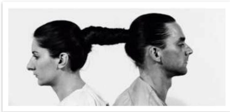
Fotografia da Performance de Marina Abramovic.

A performance é uma modalidade artística híbrida, isto é, que pode mesclar diversas linguagens como teatro, música e artes visuais. Geralmente a performance expressa uma ideia através de uma ação cênica humana.