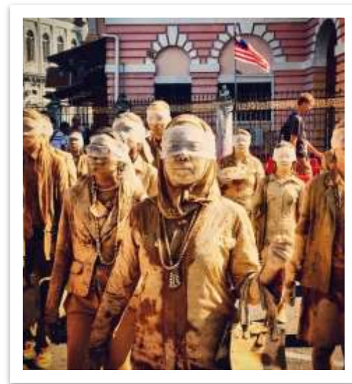
Fotografia da performance Cegos.

A linguagem da performance tem por fundamento a ação artística, que pode comunicar, instigar, provocar reflexões, criticar, poetizar. As ações ocorrem em lugares específicos, como museu ou teatro, e também em locais públicos.